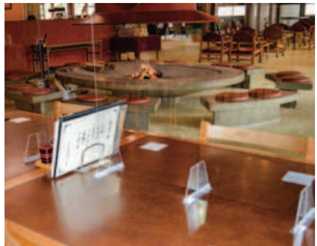
お客様に安心してレストランでお食事して頂くために飛沫防止パーテーションを設置しました。(13テーブル)